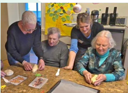
Engagiert beim Grittibänzle

Im Dezember konnten wir dank eingegangener Spenden auch das liebgewonnene Grittibänz-Backen in unserem Stützpunkt durchführen.